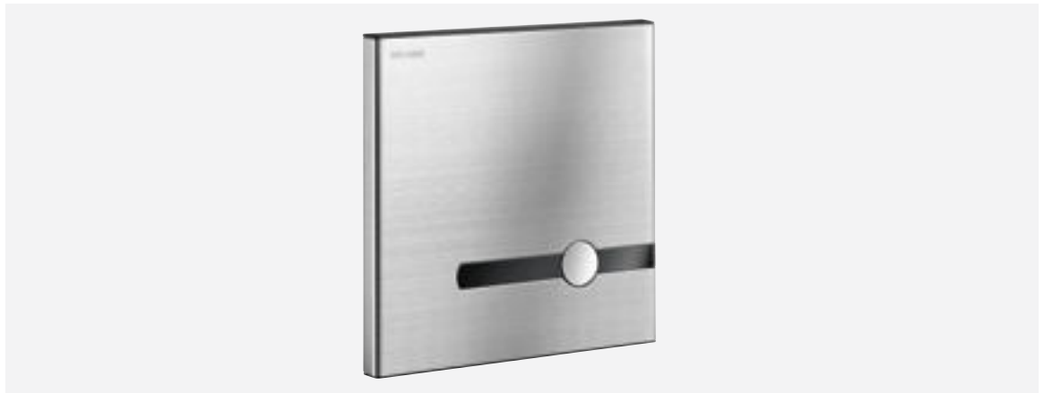
Art. DELABIE: 464SBOX + 464000

Der TEMPOMATIC mit dualer Steuerung ist mit einem innovativen, von DELABIE patentierten Unterputzkasten versehen. Er ist für alle Montagesituationen und Wandstärken von 10 bis 120 mm geeignet. Die moderne Abdeckplatte vereint Design und Vandalenschutz. Er verfügt über ein „intelligentes“ Spülsystem.