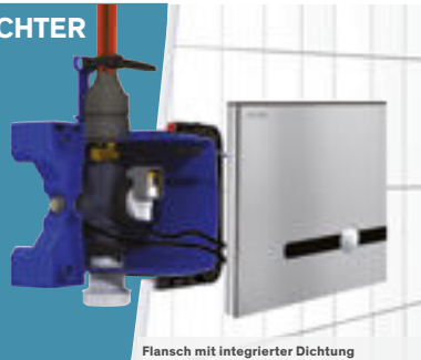
Flansch mit integrierter Dichtung