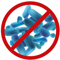
Hygiene Keine Wasserstagnation