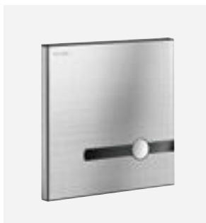
TEMPOMATIC mit dualer Steuerung Art. DELABIE: 464SBOX + 464000 oder 464SBOX + 464006

Alle Abbildungen sind auf der Webseite delabie.de verfügbar, Rubrik „Presse“.